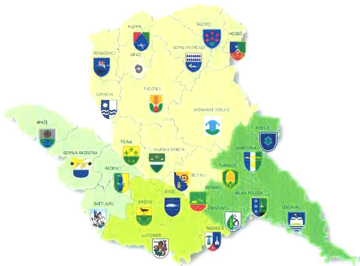
Slika 1: Območje priprave RRP 2021-2027

Apače, Beltinci, Cankova, Črenšovci, Dobrovnik, Gornja Radgona, Gornji Petrovci, Grad, Hodoš, Kobilje, Križevci, Kuzma, Lendava, Ljutomer, Moravske Toplice, Murska Sobota, Odranci, Puconci, Radenci, Razkrižje, Rogašovci, Sveti Jurij ob Ščavnici, Šalovci, Tišina, Turnišče, Velika Polana in Veržej.