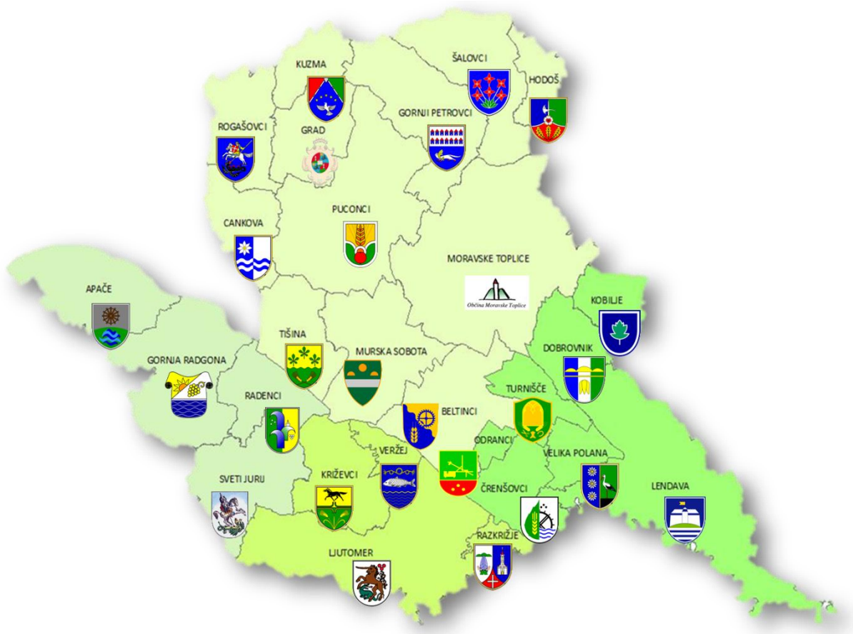
Slika 1: Območje priprave RRP 2021-2027

Apače, Beltinci, Cankova, Črenšovci, Dobrovnik, Gornja Radgona, Gornji Petrovci, Grad, Hodoš, Kobilje, Križevci, Kuzma, Lendava, Ljutomer, Moravske Toplice, Murska Sobota, Odranci, Puconci, Radenci, Razkrižje, Rogašovci, Sveti Jurij ob Ščavnici, Šalovci, Tišina, Turnišče, Velika Polana in Veržej.